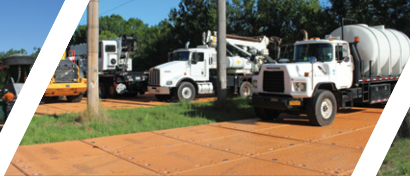
Bereitstellungsbereiche für Fahrzeuge und Ausrüstung